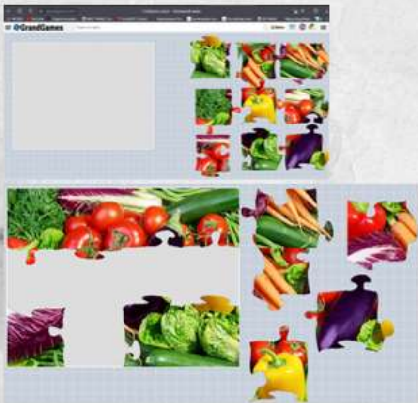
Интерактивное упражнение « Продуктовый пазл »