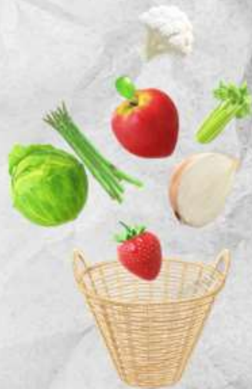
Занятие «Продуктовые корзины»