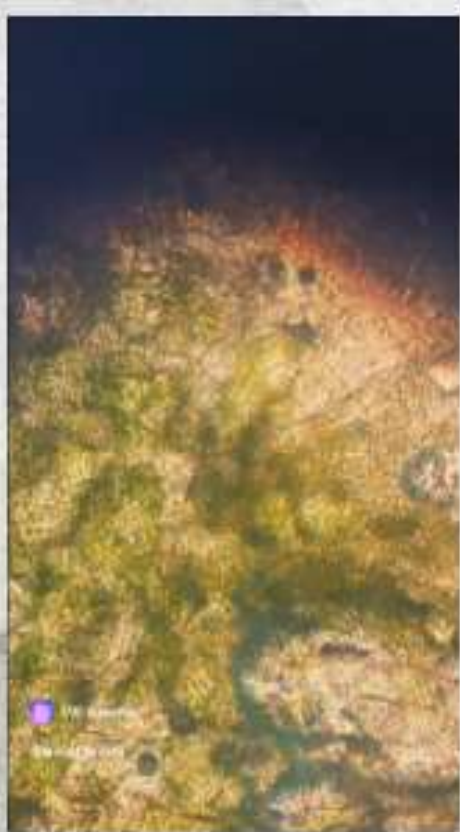
Проектно – исследовательская деятельность