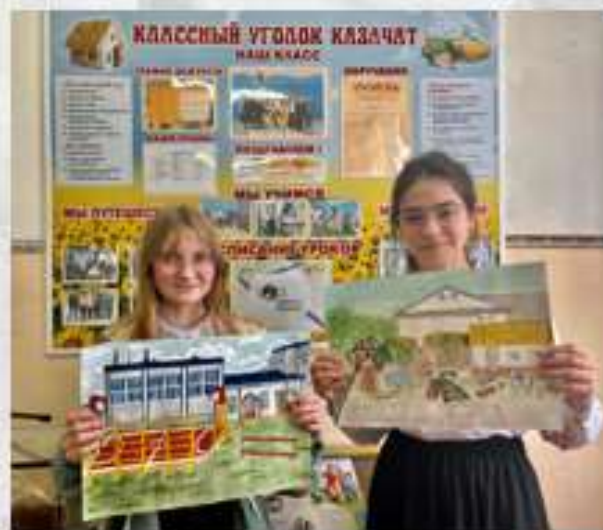
Совместная работа над проектами