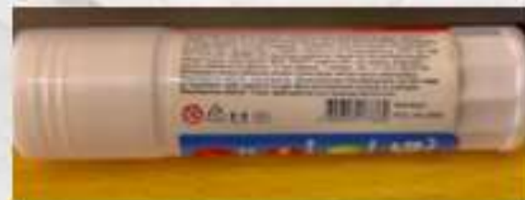
Мозговой штурм «Маркировка»