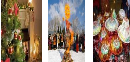
New Year Maslenitsa Easter